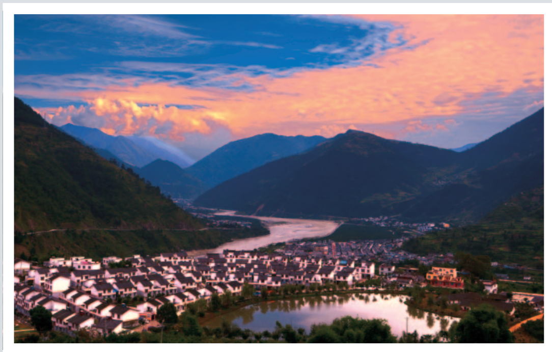
先锋松林村